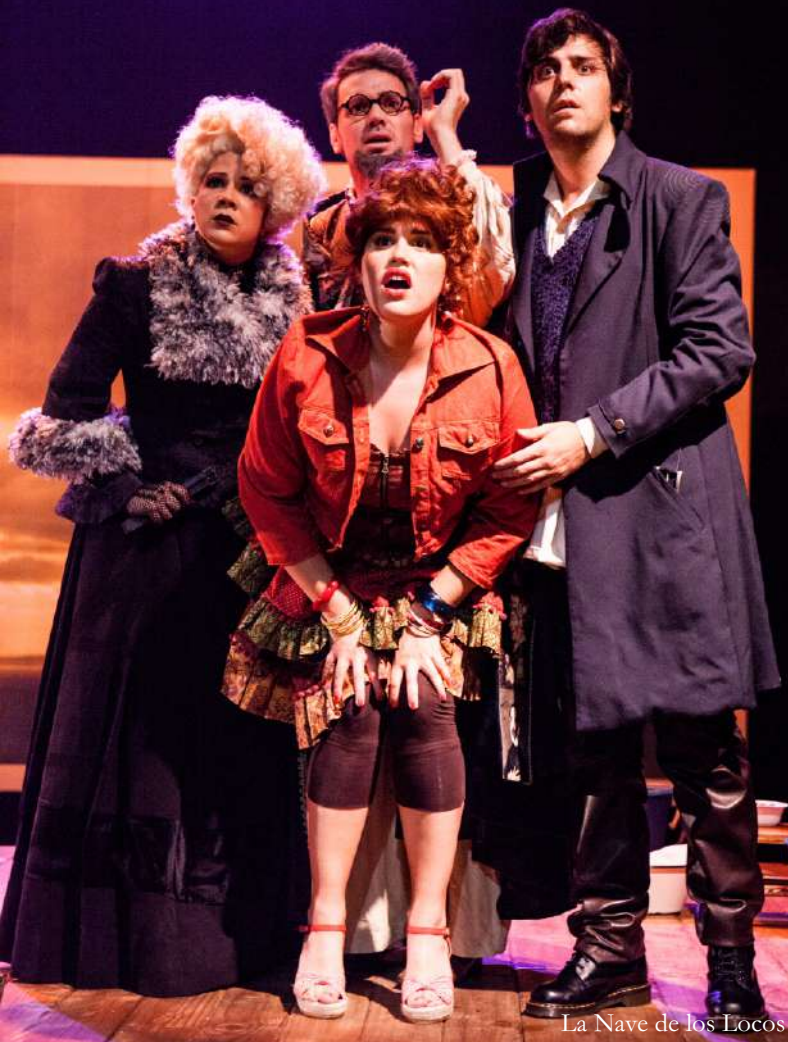
La Nave de los Locos