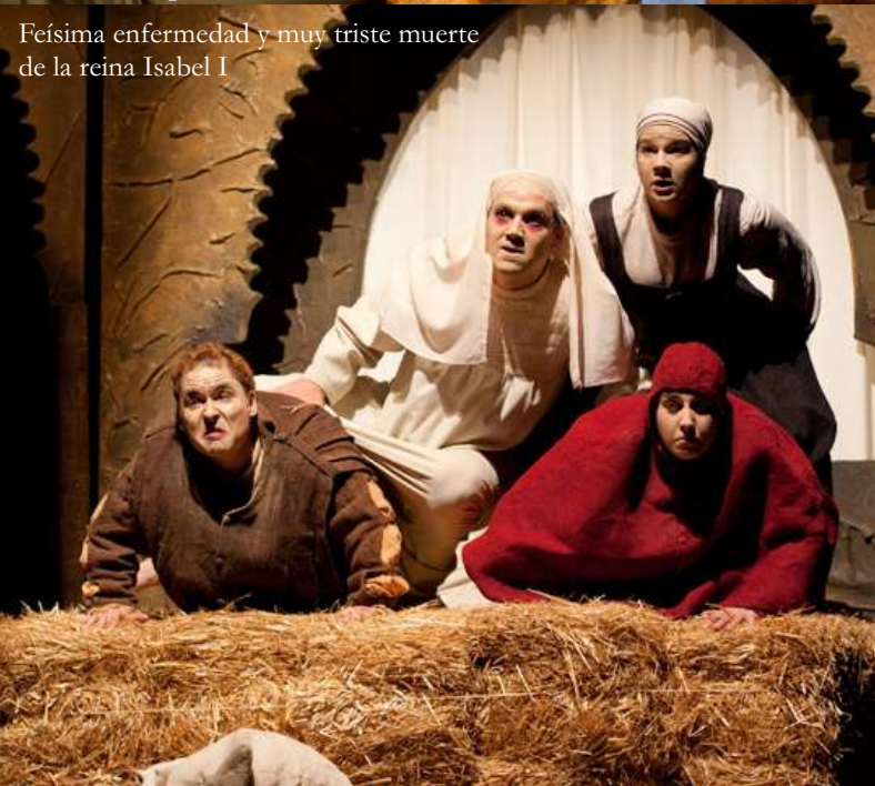
Feísima enfermedad y muy triste muerte de la reina Isabel I